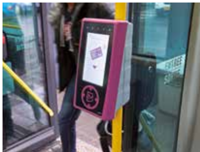
Valideur dans un bus

Continuez ensuite votre trajet en bus, train ou à vélo. Pour indiquer que vous vous êtes déplacé en transports en commun endéans 24 heures , passez votre carte devant un valideur situé en dehors de la zone Belval (p.ex. à la sortie du bus). Le message « Click OK » en haut à droite sur l'écran du valideur confirme que votre déplacement a été enregistré.